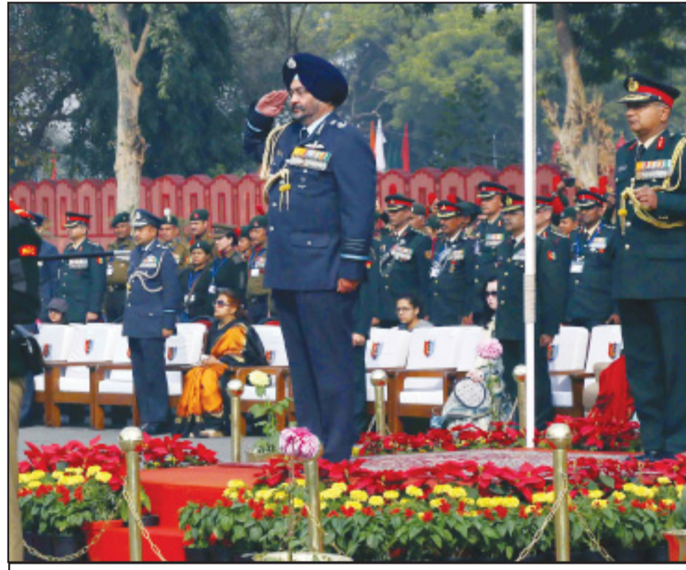
वायु सेना प्रमुख, एयर चीफ मार्शल बी.एस. धनोआ ने नई दिल्ली में एनसीसी गणतंत्र दिवस शिविर 2019 में भाग लेने वाले एनसीसी कैडेट्स द्वारा प्रस्तुत सलामी प्राप्त की।