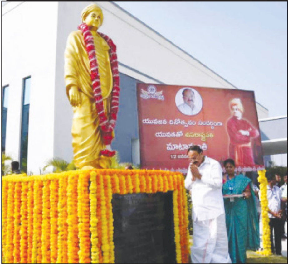
उपराष्ट्रपति, श्री एम. वैकेया नायडू हैदराबाद के मुचितल में, स्वामी विवेकानंद की बस्ट पर श्रद्धांजलि अर्पित करते हैं।