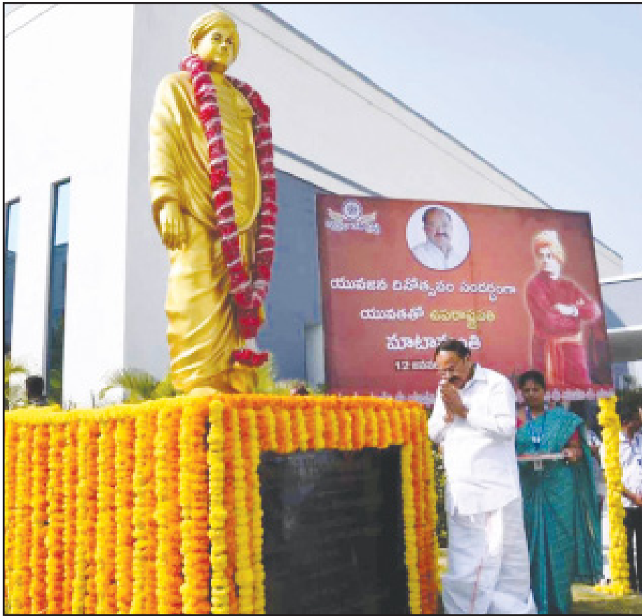
The Vice President, Shri M. Venkaiah Naidu paying homage at the Statue of Swami Vivekananda, at Swarna Bharat Trust, in Muchintal, Hyderabad.