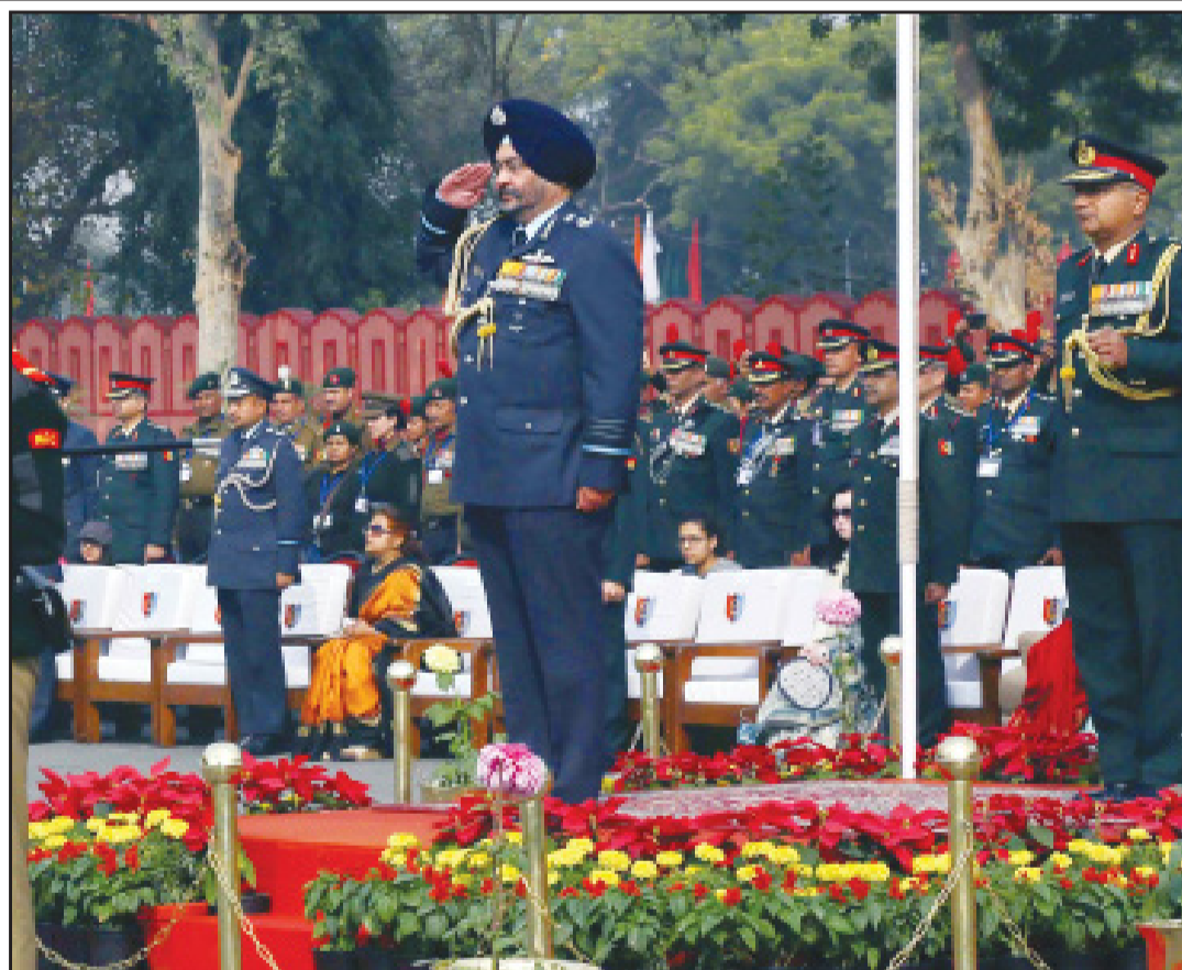
The Chief of the Air Staff, Air Chief Marshal B.S. Dhanoa receiving the salute presented by the NCC cadets participating in NCC Republic Day Camp 2019, in New Delhi. The DG: NCC, Lt. Gen. P.P. Malhotra is also seen.