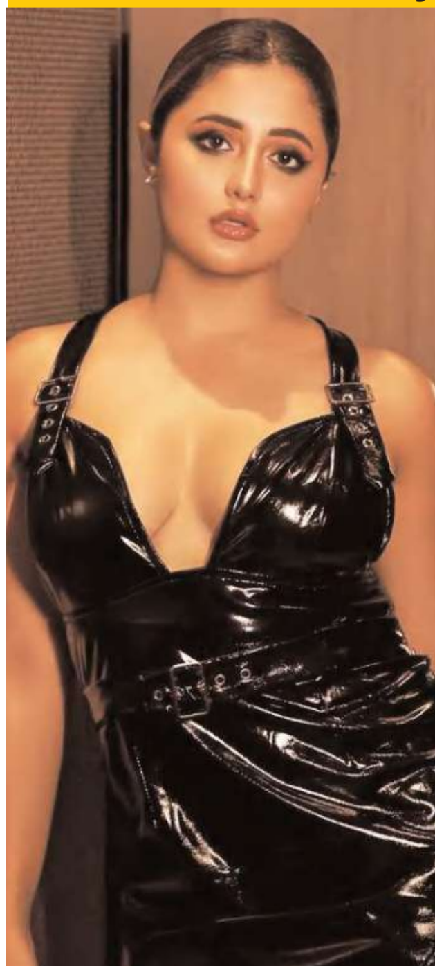
Rashami Desai is not just known for her phe-

nomenal performances on television but also for her bold fashion choices and wardrobe experiments. Her elaborate gowns for the red carpet and ethnic outfits for festive occasions are all well-praised by her fans. In case the corset trend hasn't bitten you yet, you may just be now after you see Rashami Desai in her floral pick. She opted for a strappy corset top with a plunging neckline and picked a pair of white well-tailoured high-waisted trousers. She kept her makeup glammed up with shimmering eyelids, koh-laden eyes, well-contoured cheeks and a glossy lip colour.