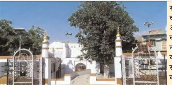
ससू नदी के तट पर बसी राजा राम की नगरी अयोध्या में पाकिस्तानी भी आकर सिर झुकाते हैं। यहां की माटी को चूमते हैं। सिर्फ पाकिस्तानी ही नहीं मलेशिया कनाडा अफगानिस्तान व इंग्लैंड सहित कई देशों से मखदूम साहब के उर्स पर रूदौली में जायरीनों का मेला लगता है।